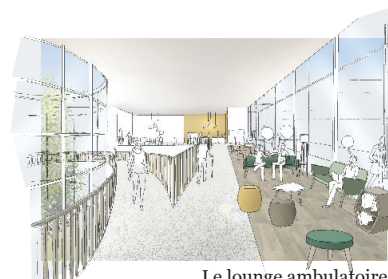
Le lounge ambulatoire