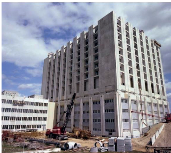
La Tour Trousseau en 1976 et au début des années 1980